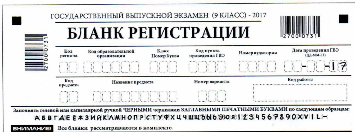
Таблица 1. Поля бланка регистрации участника ГВЭ, расположенные в верхней части бланка